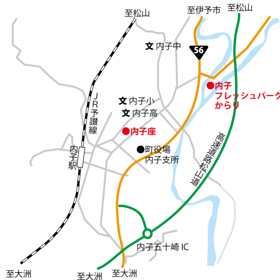
▲内子フレッシュパークからり