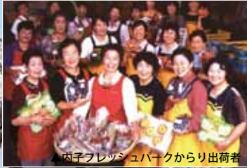
内子フレッシュパークからり出荷者