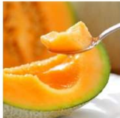
とろける甘さ島メロン