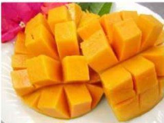
人気第1位の完熟マンゴー